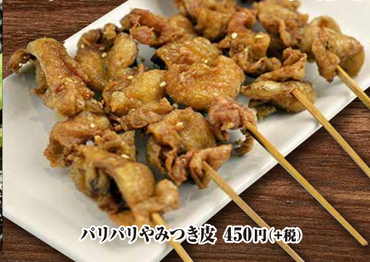
パリパリやみつき皮 450円(+税)