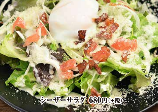
シーザーサラダ 680円(+税)

やきとりはボリューム満点!! サイドメニュー・ドリンクも充実! テイクアウトもできます♪メニューは裏面をご確認ください。