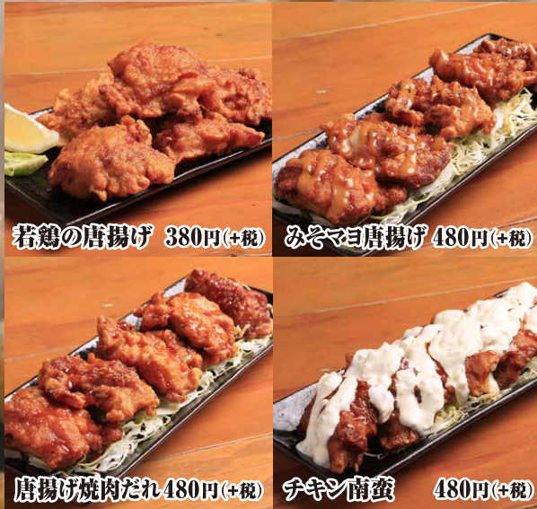
若鶏の唐揚げ 380円(+税)