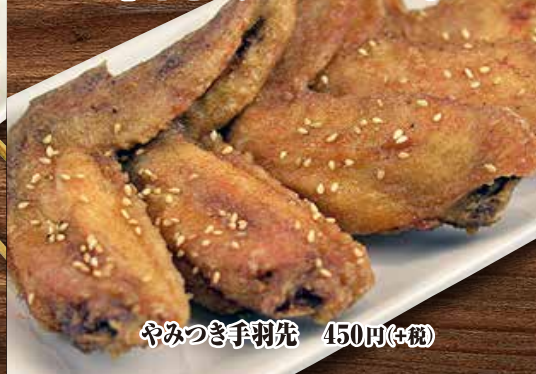
やみつき手羽先 450円(+税)